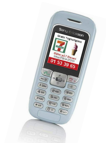
Med produkten Mobil Kupong kan olika värdehandlingar distribueras direkt till mottagarens mobiltelefon.

Kundlojalitet och belöningar börjar ta allt mer plats som ett marknadsföringsverktyg och för att trygga en kundlojalitet inom handeln. I och med koncernens totallösning för denna hantering kommer vi att inta en ställning som en betydande aktör på marknaden. I och med bolagets ansträngningar till att göra sin applikation anpassad till PC integrerade lösningar är det ledningens bestämda uppfattning att marknadsfönstret återigen står öppet för bo-